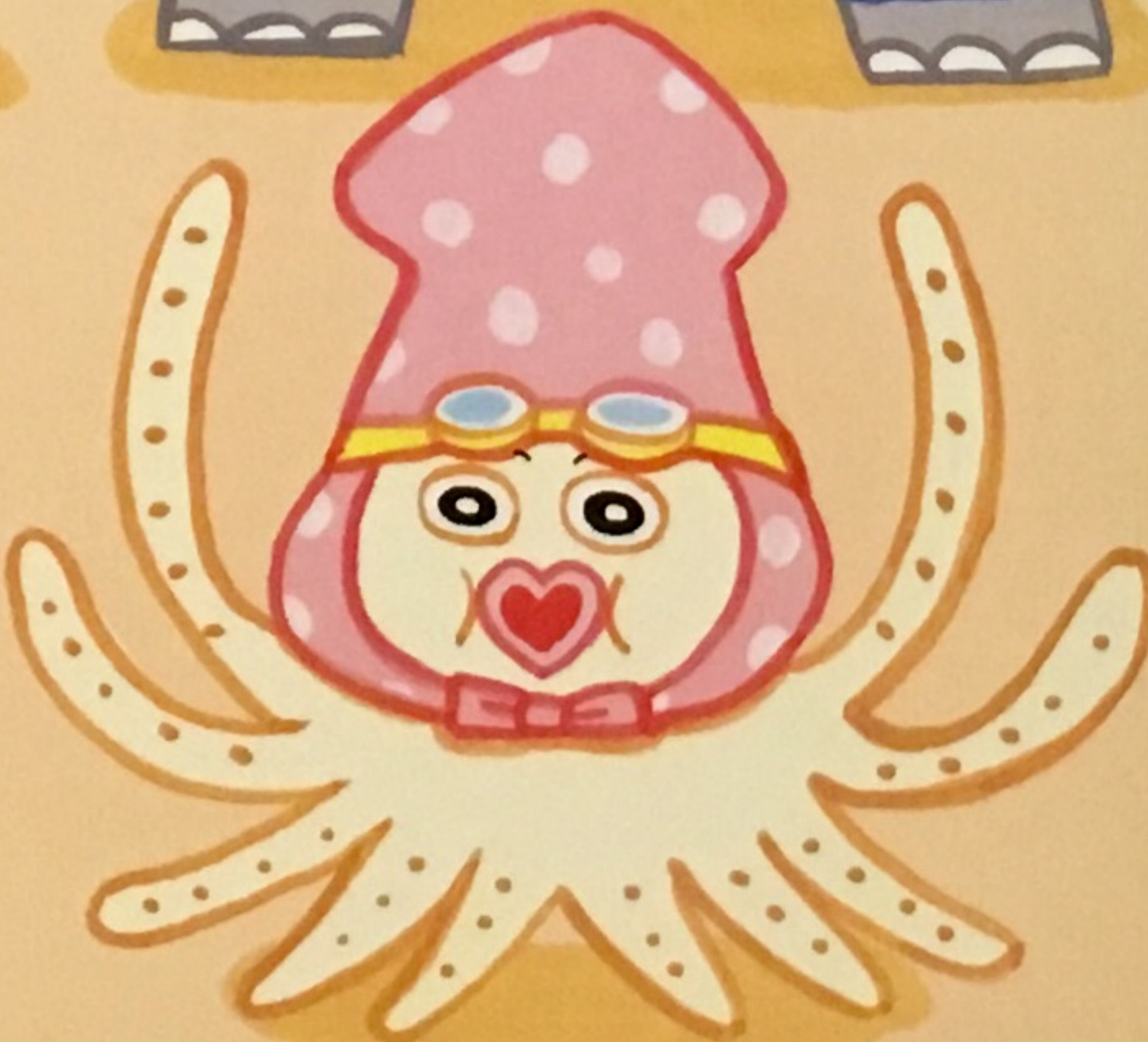
たたもうじゃなイカ